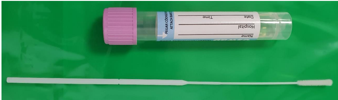
Figura 1. Hisopo de toma de muestras y medio de transporte.

como colocarse y quitarse el EPI de forma segura.