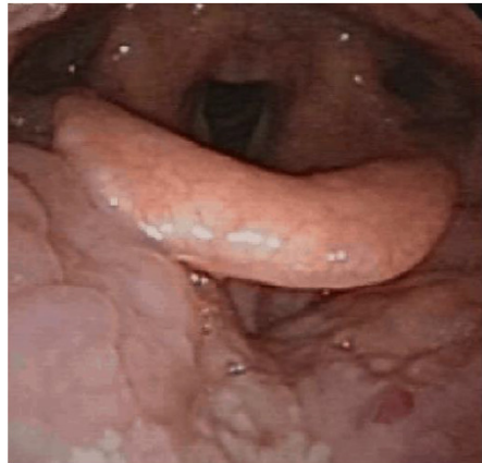
Estimulador hipogloso on

Desde un punto de vista de colaboración entre especialidades, en nuestro país y con la publicación del Documento de Consenso, se han visto cambios significativos que han llevado a un incremento del interés por esta patología por parte de nuevas generaciones de otorrinolaringólogos. Pocos años después del Documento de Consenso del SAHOS en adultos, se redactó el Documento de Consenso de SAHOS en niños, con una participación activa de nuestra sociedad. Actualmente se está diseñando una Guía de Práctica Clínica sobre la exploración de la Vía Aérea Superior en pacientes con SAHOS, promovida por la Sociedad Española de Sueño y la Sociedad Española de Otorrinolaringología. El liderazgo del proyecto corre a nuestro cargo, pero con participación de diversas disciplinas implicadas en patología del sueño.