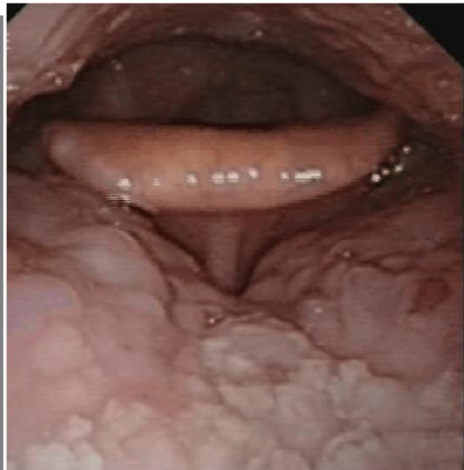
Estimulador hipogloso off